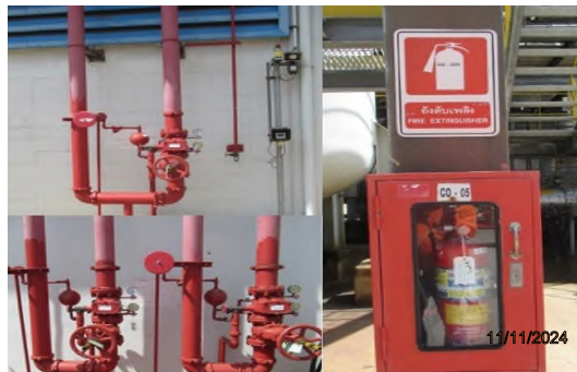
ภาพถ่ายที่ 2.2.2-49 อุปกรณ์ป้องกันและระงับอัคคีภัยในพื้นที่ Coke Warehouse