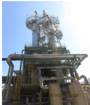
ภาพถ่ายที่ 2.2.2-8 หอถ่านกัมมันต์สำหรับดูดซับซัลเฟอร์