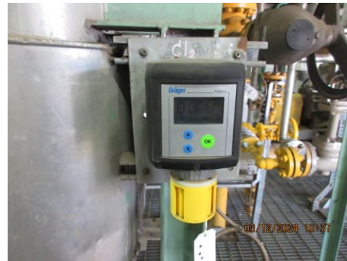
ภาพถ่ายที่ 2.2.2-56 CO/Cl 2 Online Analyzers