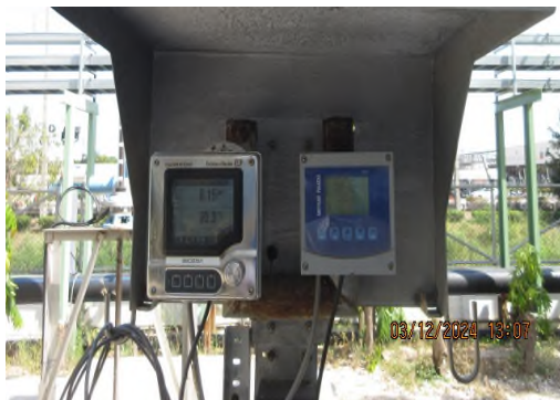
ภาพถ่ายที่ 2.2.2-11 อุปกรณ์ตรวจวัดอัตโนมัติ Phenolic Online