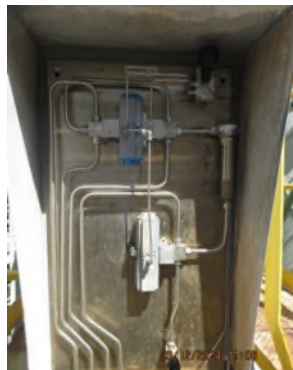
ภาพถ่ายที่ 2.2.2-10 ระบบบำบัดน้ำเสียของส่วนผลิต PC