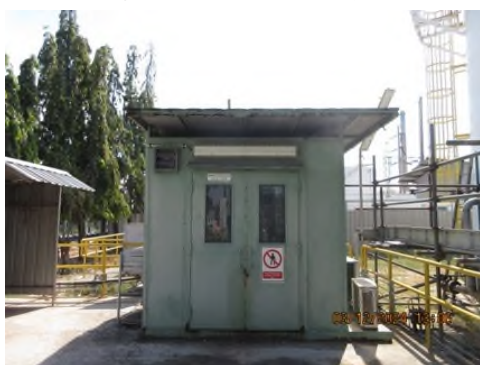
ภาพถ่ายที่ 2.2.2-3 FID On-line