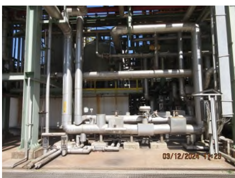
ภาพถ่ายที่ 2.2.2-38 ติดตั้งระบบ Safety Valves และฉนวนหุ้มท่อส่งไอน้ำในพื้นที่โครงการ