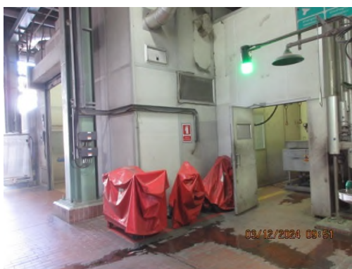
ภาพถ่ายที่ 2.2.2-23 บริเวณที่มีการติดตั้งอุปกรณ์ เพื่อลดความดังเสียงและป้องกันเสียง