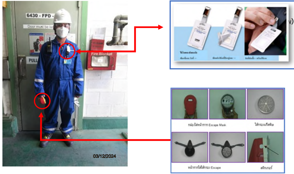
ภาพถ่ายที่ 2.2.2-32 อุปกรณ์คุ้มครองความปลอดภัยส่วนบุคคลสำหรับพนักงานที่ต้องเข้าไปปฏิบัติงานในหน่วยผลิตฟอสจีน