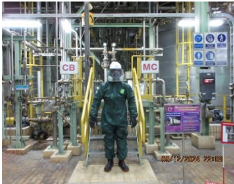
ภาพถ่ายที่ 2.2.2-33 พนักงานสวมใส่ชุดอุปกรณ์คุ้มครองความปลอดภัยส่วนบุคคล บริเวณที่ปฏิบัติงานกับสารเคมี MC และ CB