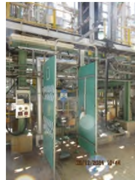
ภาพถ่ายที่ 2.2.2-34 ฝักบัวและที่ล้างตาฉุกเฉิน ในพื้นที่ที่เกี่ยวข้องกับสารเคมี