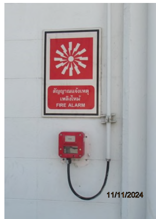
ภาพถ่ายที่ 2.2.2-51 ปุ่มแจ้งสัญญาณไฟไหม้ (Fire Alarm Button) ในส่วนผลิต CO