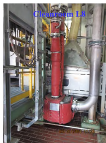
ภาพถ่ายที่ 2.2.2-26 อุปกรณ์ครอบเครื่องจักรที่มีเสียงดัง