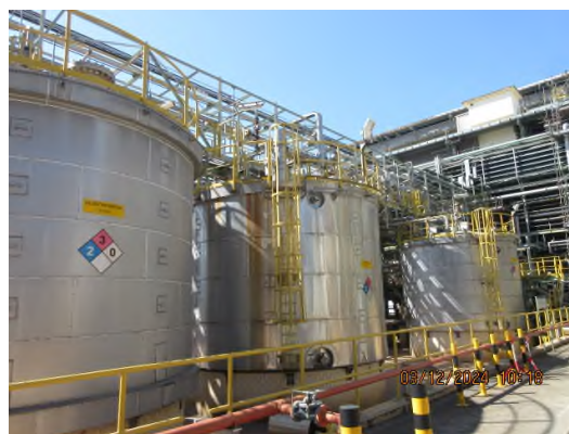
ภาพถ่ายที่ 2.2.2-31 Organic Tank Farm และ Chemical Tank Farm