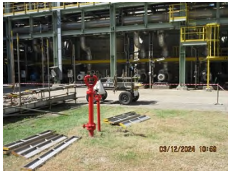
หัวฉีดน้ำดับเพลิง