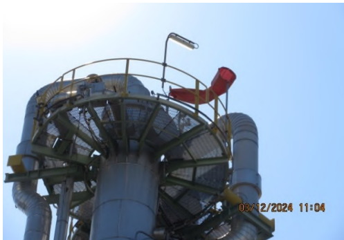
ภาพถ่ายที่ 2.2.2-44 Wind Sock