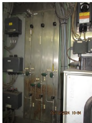
ภาพถ่ายที่ 2.2.2-53 เครื่องตรวจวัดฟอสจีน