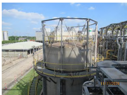
ภาพถ่ายที่ 2.2.2-41 อุปกรณ์วัดระดับแบบวัดค่าต่อเนื่อง