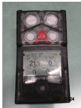
ภาพถ่ายที่ 2.2.2-37 CO Concentration Portable Detector