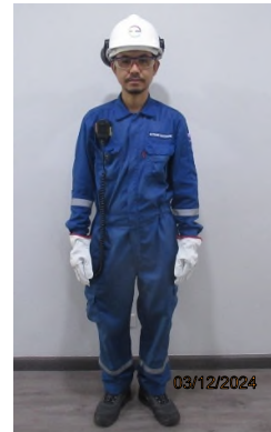
ภาพถ่ายที่ 2.2.2-29 พนักงานสวมใส่อุปกรณ์คุ้มครองความปลอดภัยส่วนบุคคล