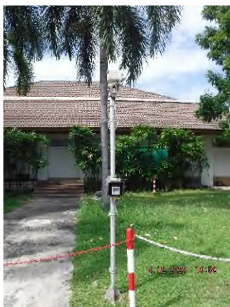
ภาพถ่ายที่ 2.2.2-50 เครื่องตรวจจับ CO แบบต่อเนื่อง (CO Concentration Online) ในส่วนผลิต CO