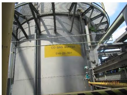
ภาพถ่ายที่ 2.2.2-39 ระบบ Gas Buffer