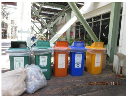
ภาพถ่ายที่ 2.2.2-20 ถังขยะแยกประเภทพร้อมฝาปิด