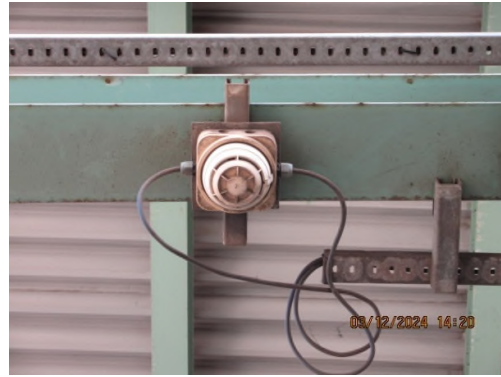
ภาพถ่ายที่ 2.2.2-58 เครื่องตรวจจับก๊าซไวไฟ (Flammable Gas Detector)