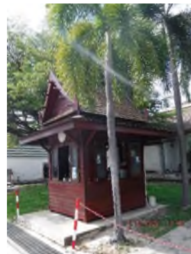
ภาพถ่ายที่ 2.2.2-60 จุดตรวจผ่านเข้า-ออกโครงการฯ