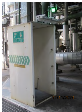
ภาพถ่ายที่ 2.2.2-36 ฝักบัวฉุกเฉินและอ่างล้างตาฉุกเฉิน ส่วนผลิต CO