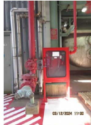
ภาพถ่ายที่ 2.2.2-43 ระบบป้องกันและระงับอัคคีภัยที่ติดตั้งภายในโรงงาน