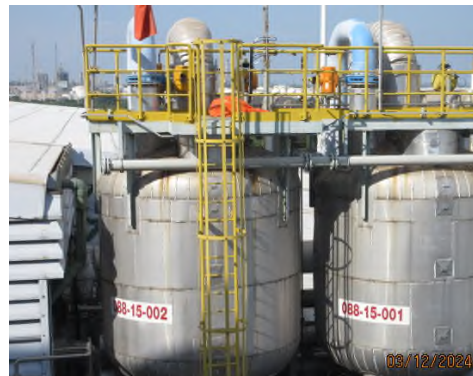
ภาพถ่ายที่ 2.2.2-2 ระบบกำจัดก๊าซเสีย (Offgas Cleaning System)