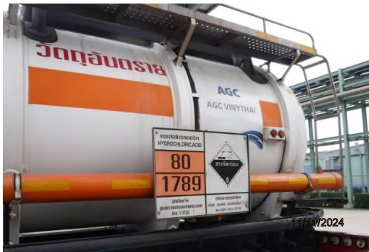
ภาพถ่ายที่ 2.2.2-61 รถขนส่งวัตถุดิบและสารเคมี