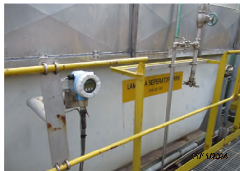
ภาพถ่ายที่ 2.2.2-14 รางระบายน้ำภายในโครงการ ส่วนผลิต PC