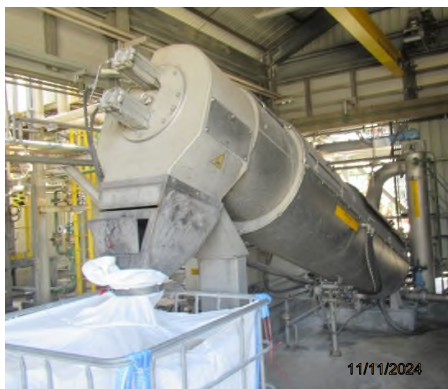
ภาพถ่ายที่ 2.2.2-19 เครื่องรีดตะกอน (Sludge Press)