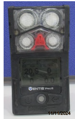
ภาพถ่ายที่ 2.2.2-7 หอเหล็กไฮดรอกไซด์ สำหรับกำจัดซัลเฟอร์