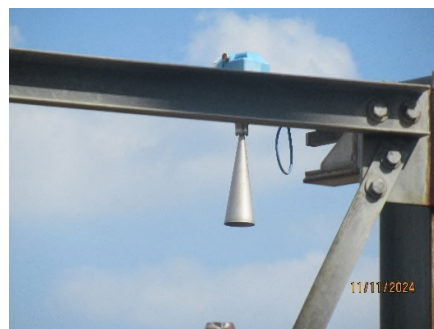
ภาพถ่ายที่ 2.2.2-40 อุปกรณ์วัดระดับแบบวัดเฉพาะ จุดแบบ Local Scale