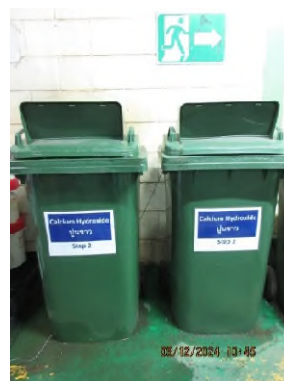
ภาพถ่ายที่ 2.2.2-22 ถังเก็บสารดูดซับ กรณีฟอสจีนเหลวรั่วไหล