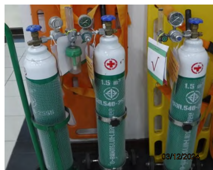
ภาพถ่ายที่ 2.2.2-28 ถังออกซิเจนภายในห้องพยาบาล