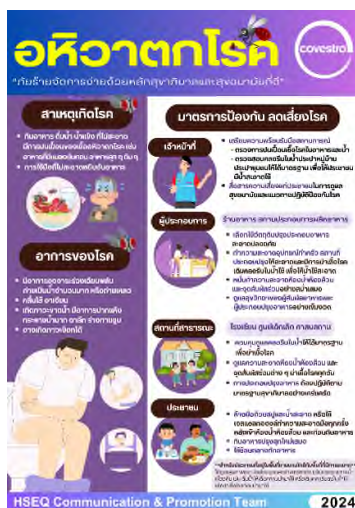
ภาพถ่ายที่ 2.2.2-63 ป้ายประชาสัมพันธ์ให้ความรู้กับพนักงานในการป้องกันโรคติดต่อ