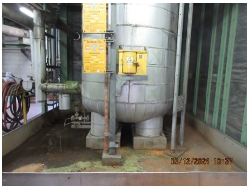
ภาพถ่ายที่ 2.2.2-52 ถังพัก (Buffer Vessel)