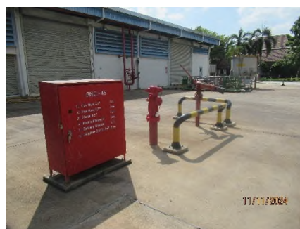
ภาพถ่ายที่ 2.2.2-48 อุปกรณ์ป้องกันและระงับอัคคีภัยในพื้นที่ส่วนผลิต CO