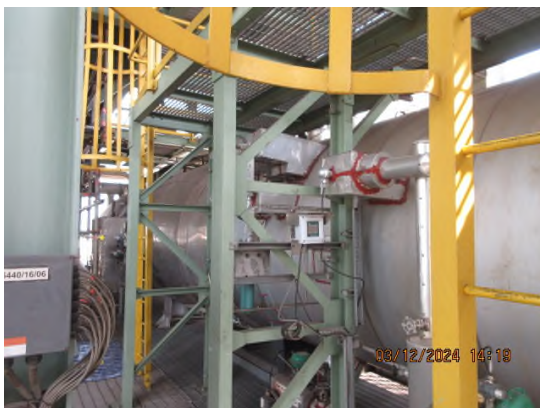
ภาพถ่ายที่ 2.2.2-4 ระบบ Thermal Oxidizer (TO)