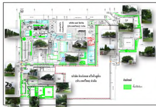
ภาพถ่ายที่ 2.2.2-62 พื้นที่สีเขียว