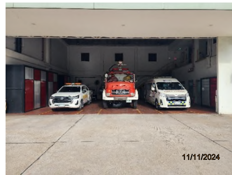
ภาพถ่ายที่ 2.2.2-45 รถดับเพลิง รถบรรเทาสาธารณภัยและ รถพยาบาลกรณีฉุกเฉิน