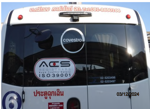
ภาพถ่ายที่ 2.2.2-59 รถรับส่งพนักงาน