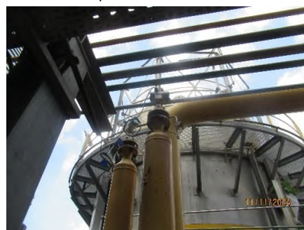
ภาพถ่ายที่ 2.2.2-42 อุปกรณ์วัดความดัน