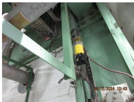
ภาพถ่ายที่ 2.2.2-47 ระบบสัญญาณเตือนแจ้งเหตุส่วนผลิต PC