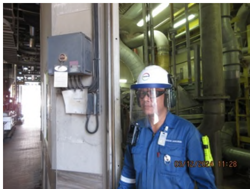
ภาพถ่ายที่ 2.2.2-25 พนักงานสวมใส่อุปกรณ์ป้องกันเสียง