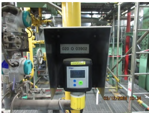
ภาพถ่ายที่ 2.2.2-55 ชุดอุปกรณ์เพื่อความปลอดภัยที่ติดตั้งกับเครื่องจักรในหน่วยฟอสจีน