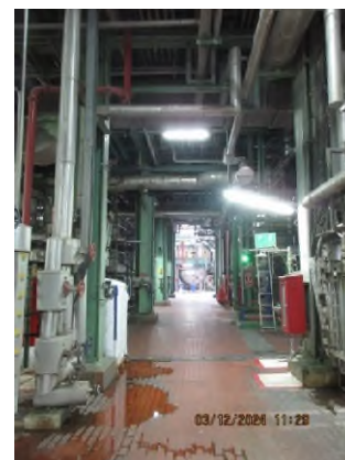
ภาพถ่ายที่ 2.2.2-30 ไฟส่องสว่างภายในพื้นที่โครงการ