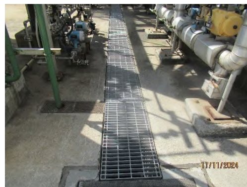
ภาพถ่ายที่ 2.2.2-16 ระบบบำบัดน้ำเสียของส่วนผลิต CO