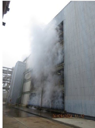
ภาพถ่ายที่ 2.2.2-54 การทดสอบน้ำยา Steam-Ammonia