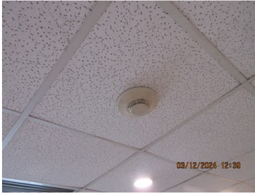
ภาพถ่ายที่ 2.2.2-57 Smoke Detector บริเวณส่วนผลิต PC