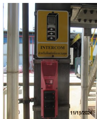
ภาพถ่ายที่ 2.2.2-5 Intercom สำหรับติดต่อห้องควบคุม