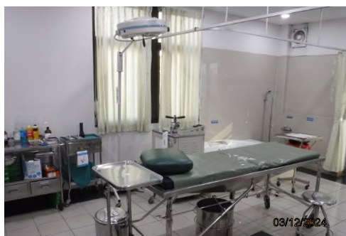
ภาพถ่ายที่ 2.2.2-27 ห้องพยาบาลภายในพื้นที่โครงการ