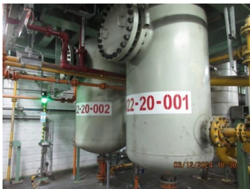
ภาพถ่ายที่ 2.2.2-1 ระบบกำจัดก๊าซฟอสจีน (Phosgene Decomposition System)